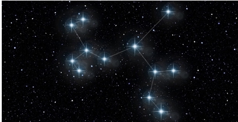
Ein Sternbild: Sterne werden mit „gedachten“ Linien verbunden, sodass eine bestimmte Figur erkennbar ist.

Hast du schon einmal Sternbilder am Himmel entdeckt? Kennst du sogar schon Namen von Sternbildern?